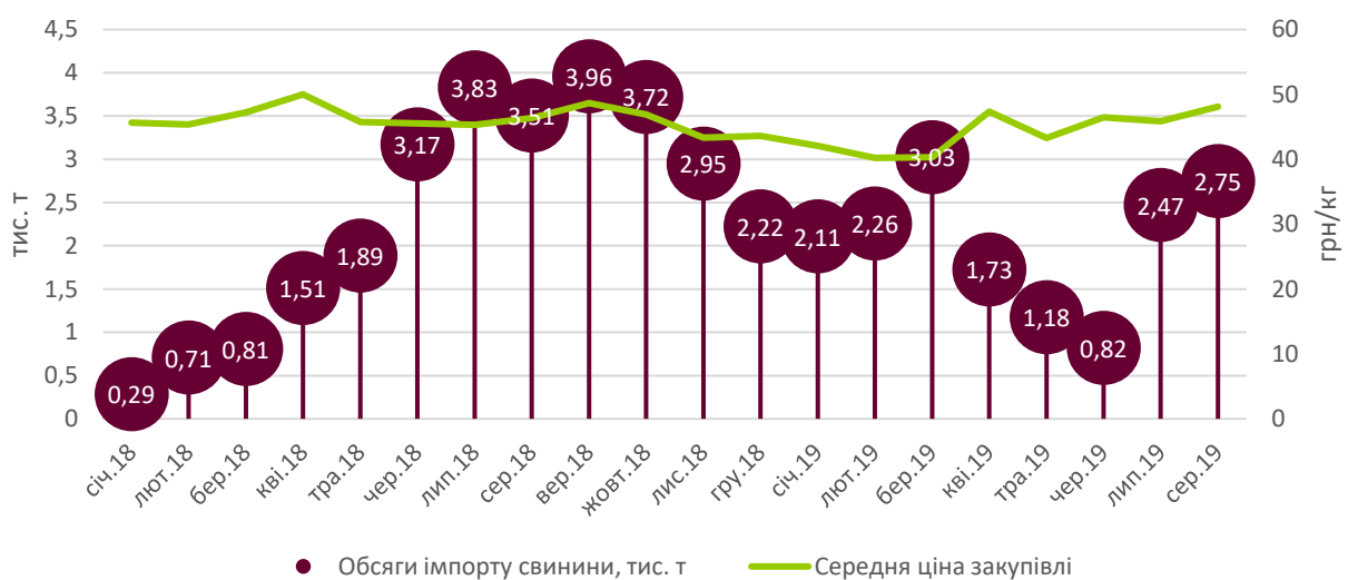
Помісячна динаміка імпорту м'яса свиней (УКТ ЗЕД 0203)

Втім, експерти зазначають, що минулого серпня зовнішні поставки свинини були активнішими: за серпень 2018-го на внутрішній ринок надійшло на чверть більше свіжого, охолодженого та мороженого м'яса свиней ніж цього року — 3,5 тис. т. «Хоча сукупні обсяги імпорту свинини все ще перевищують торішні (16,33 тис. т проти 15,71 тис. т за січень-серпень 2018-го), це відхилення скоротилося до 4%,» — зазначають в АСУ.