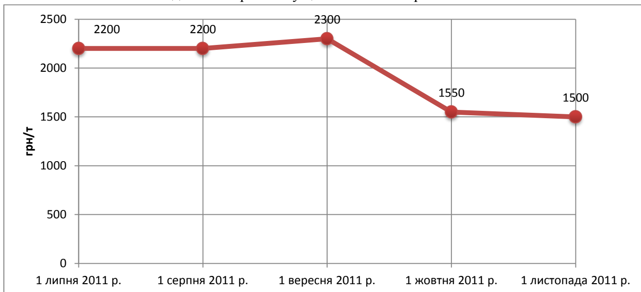
Рис. 1. Прогноз ціни попиту на соняшниковий шрот в Україні, по місяцях, грн/т