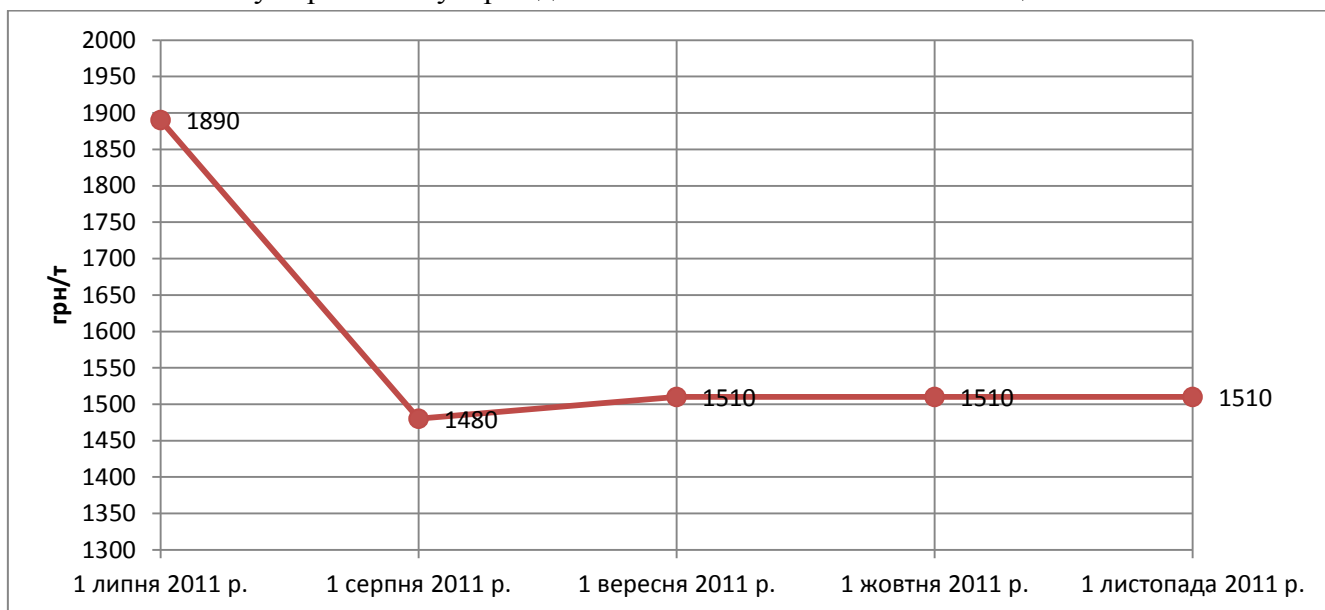
Рис. 1. Прогноз ціни пропозиції на пшеницю в Україні, грн/т